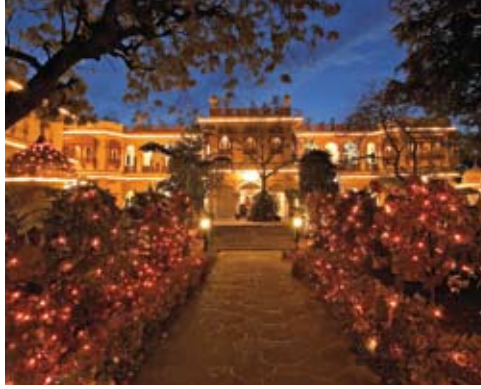
À Jaipur, jardin du Alsisar Haveli