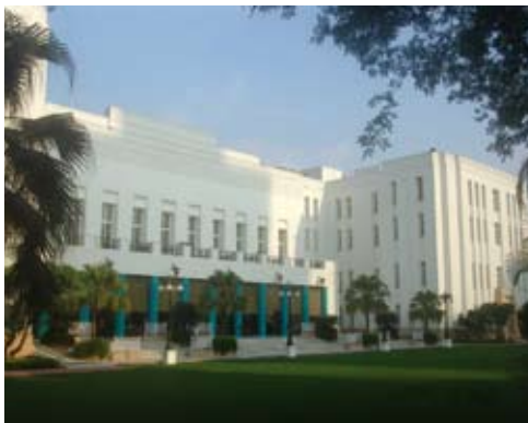
L'Imperial Hotel à New Delhi

Construit en 1892, il en a gardé le style et l'esprit, avec ses arcades, ses cours ombragées, son jardin entourant le bassin d'eau devenu piscine, ses meubles antiques et ses étoffes du style Rajasthani.