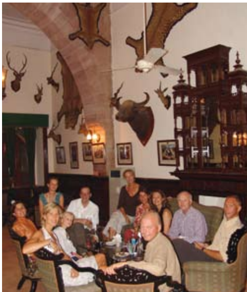
Au bar du Laxmi Niwas Palace