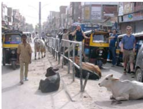
À Bikaner, en pleine ville, vaches sacrées et taxis tuc tuc attendent le passage du train