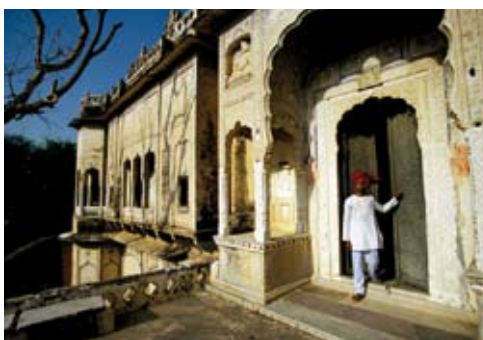
Entrée du havéli Indra Vilas hotel