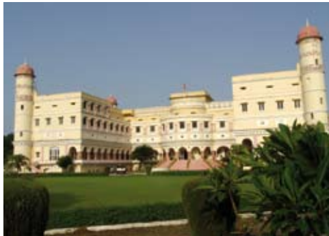
The Sariska Palace, près de la réserve animale