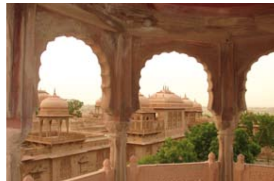
Vue d'une terrasse du Laxmi Niwas Palace