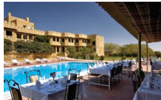
Rang Mahal Palace à Jaisalmer